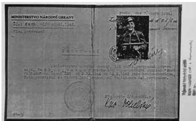
Detail potvrzení o statusu partyzána.