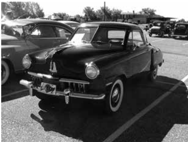
Studebaker Champion.