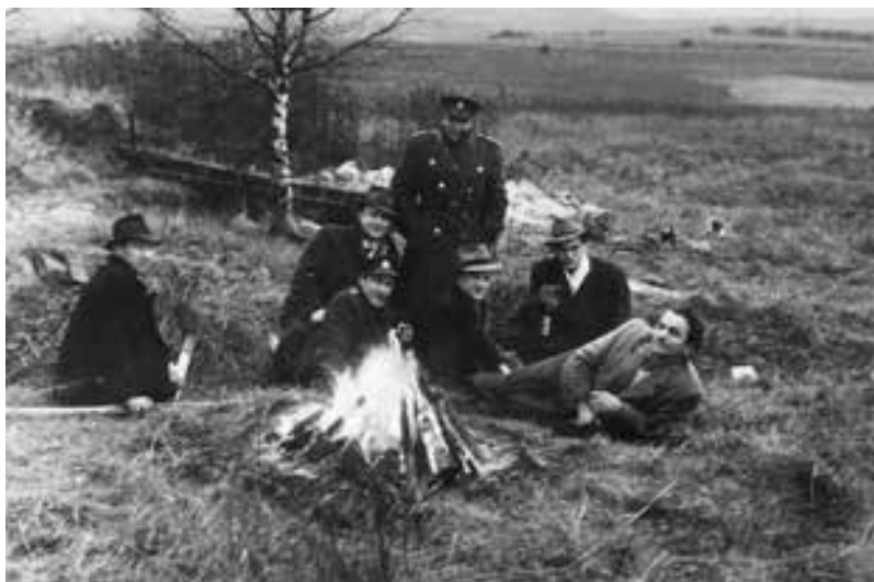
Hledání ostatků Petlanových v prostoru bývalého dolu.

Bělousov a Skomarovský se na průběhu vraždy ve výpovědi neshodují. Petlanovy odvedli k Bělousovovým domů, popili spolu a nechali je jít spát. Po půlnoci je měl Skomarovský vzbudit a odvézt za hranice. Jenže namísto toho vzal do ruky kladivo. Zatímco Bělousov tvrdí, že vraždil Skomarovský, podle Skomarovského vraždili společně a každý má na svědomí jednu oběť. Protichůdné výpovědi mají každá jednoho potvrzujícího svědka – manželku.